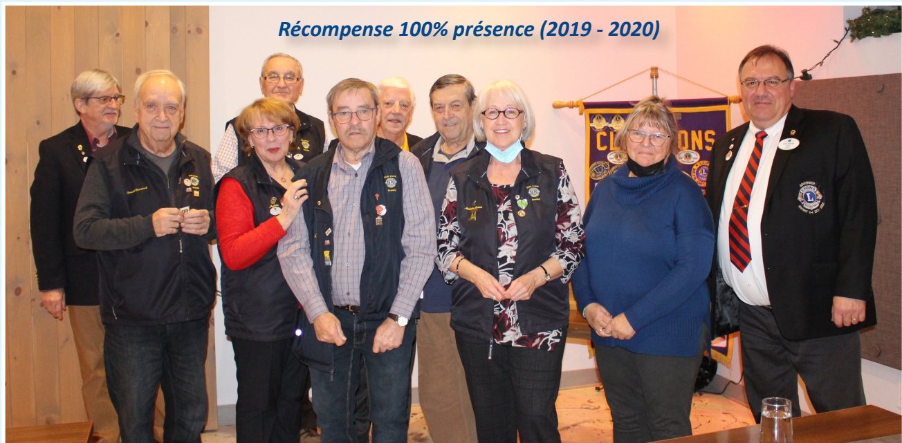
Récompense 100% présence (2019 - 2020)